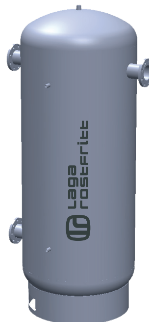
Exempel på utförande